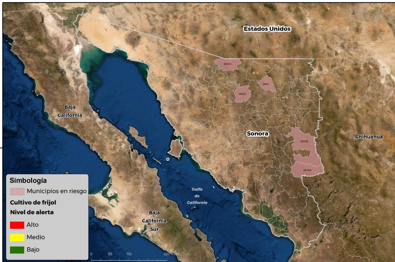
Municipios con cultivo y probable riesgo por Conchuela del frijol en Sonora

GEOMÁTICA-D3-SENASICA © 2021 RGR FECHA: 22-JUNIO-2021