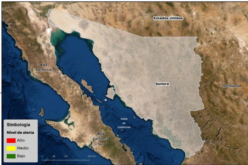
Nivel de alerta por Conchuela del frijol en Sonora

Se identifica que la plaga puede comenzar su desarrollo debido a que hay: