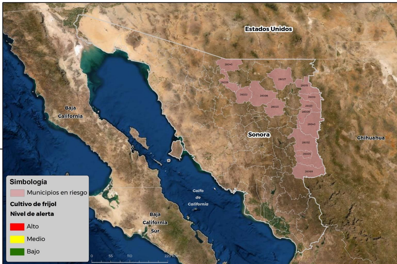
Municipios con cultivo y probable riesgo por Conchuela del frijol en Sonora

GEOMÁTICA-D3-SENASICA © 2021 RGR FECHA: 26-JULIO-2021