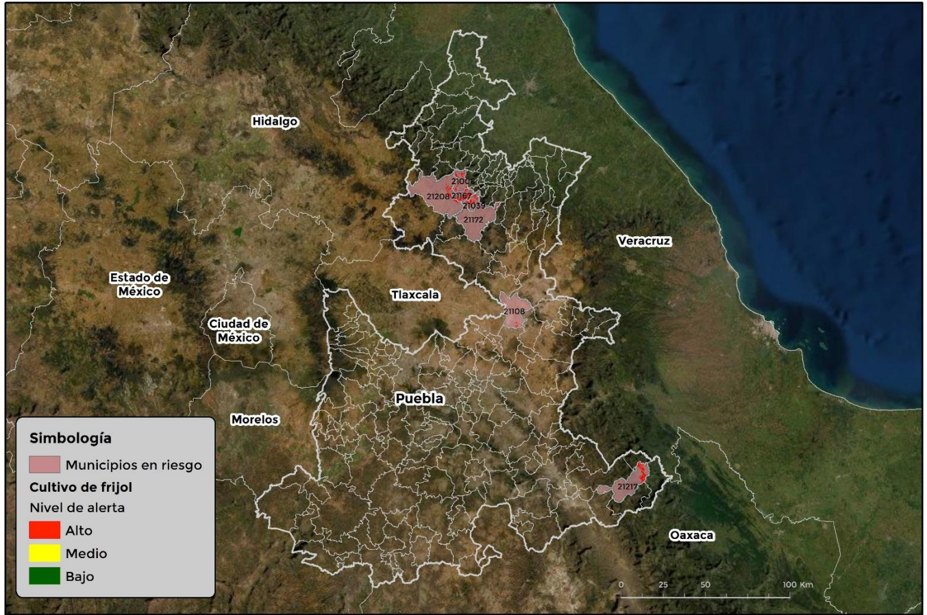
Municipios con cultivo y probable riesgo por Conchuela de frijol en Puebla

Anexo 1.- Se han identificado 8 municipios con alto riesgo y presencia del cultivo para el desarrollo de Conchuela del frijol, mismos que en caso de presentarse la plaga estarían en riesgo.