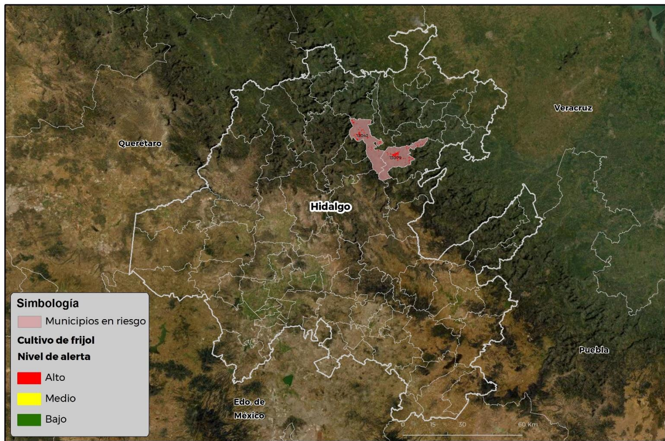
Municipios con cultivo y probable riesgo por Conchuela del frijol en Hidalgo

GEOMÁTICA-D3-SENASICA © 2021 RGR FECHA: 02-JUNIO-2021