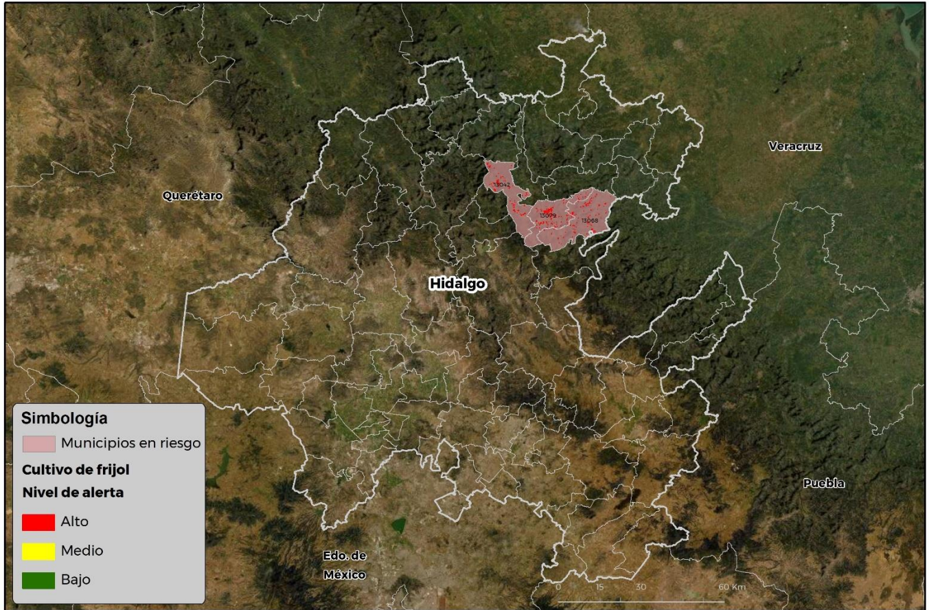
Municipios con cultivo y probable riesgo por Conchuela del frijol en Hidalgo

GEOMÁTICA-D3-SENASICA © 2021 RGR FECHA: 21-JUNIO-2021