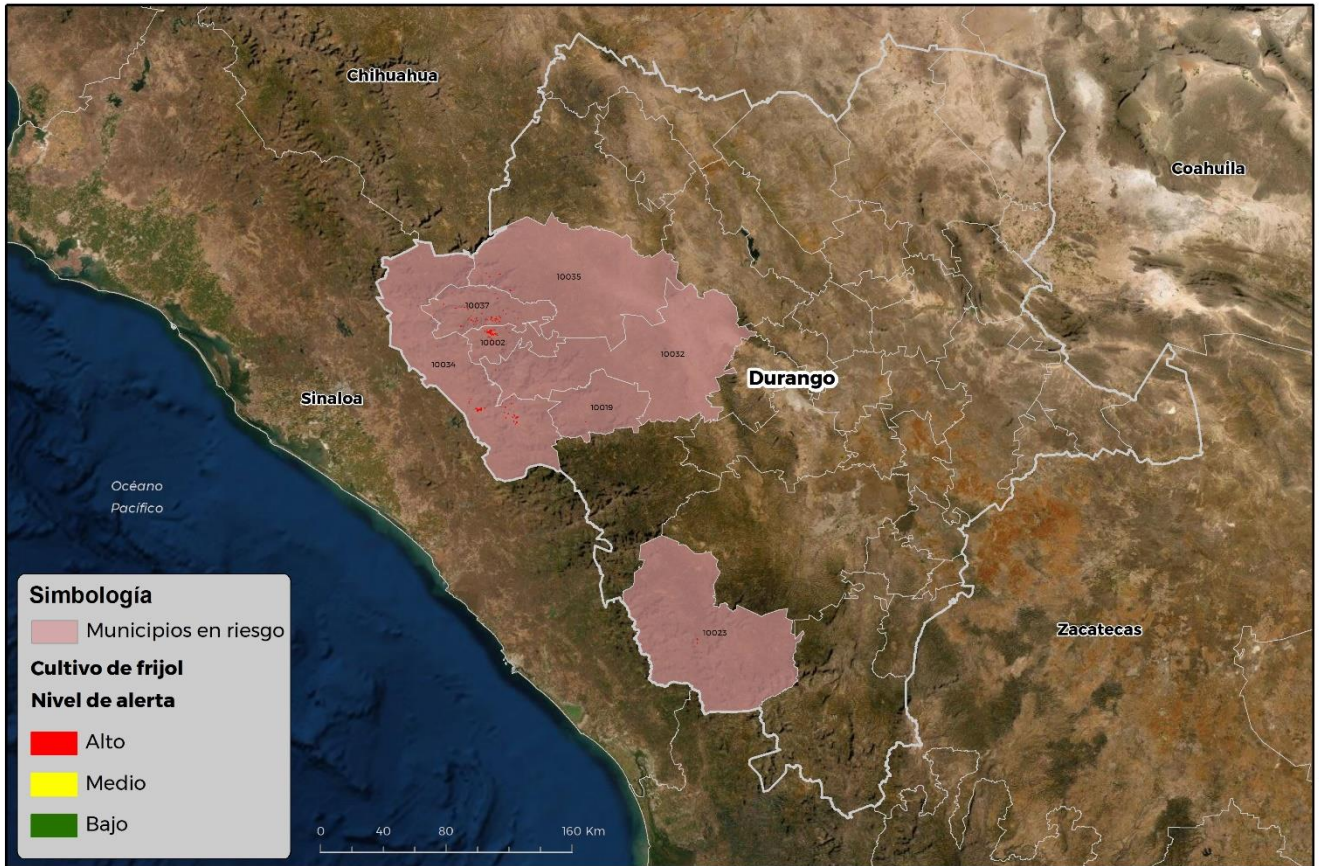
Municipios con cultivo y probable riesgo por Conchuela del frijol en Durango

GEOMATICA-D3-SENASICA © 2021 RCR FECHA: 21-JUNIO-2021