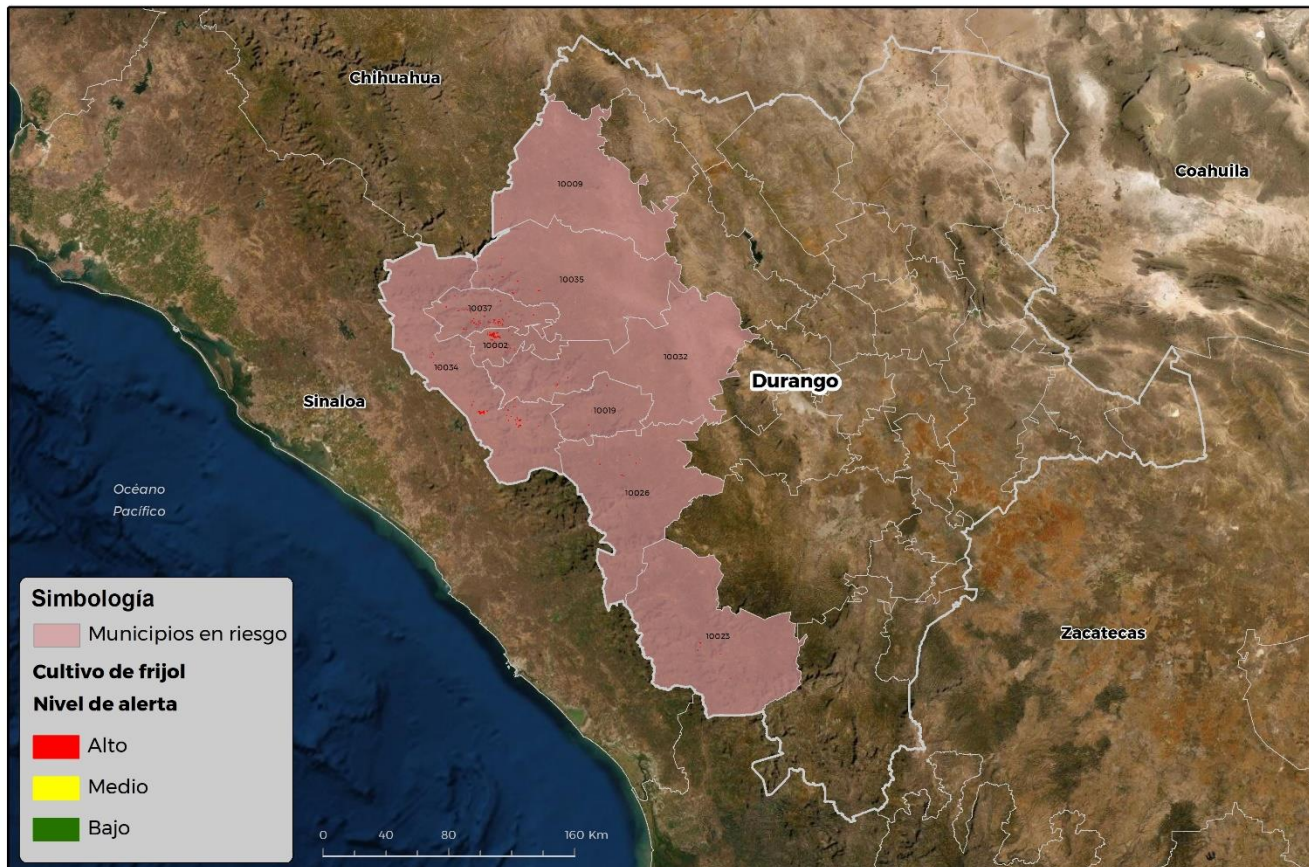
Municipios con cultivo y probable riesgo por Conchuela del frijol en Durango

GEOMÁTICA: D3-SENASICA © 2021 RGR FECHA: 07-JULIO-2021