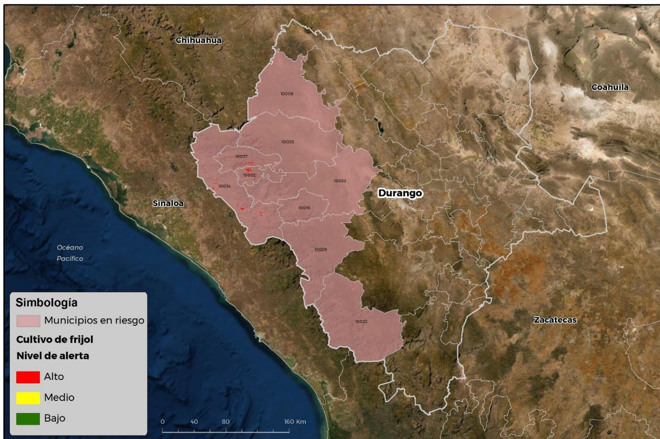
Municipios con cultivo y probable riesgo por Conchuela del frijol en Durango

GEOMATICA-D3-SENASICA © 2021 RGR FECHA: 26 JULIO-2021