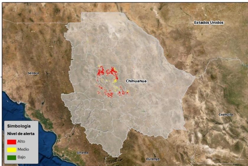
Nivel de alerta por Conchuela del frijol en Chihuahua

Se identifica que la plaga puede comenzar su desarrollo debido a que hay: