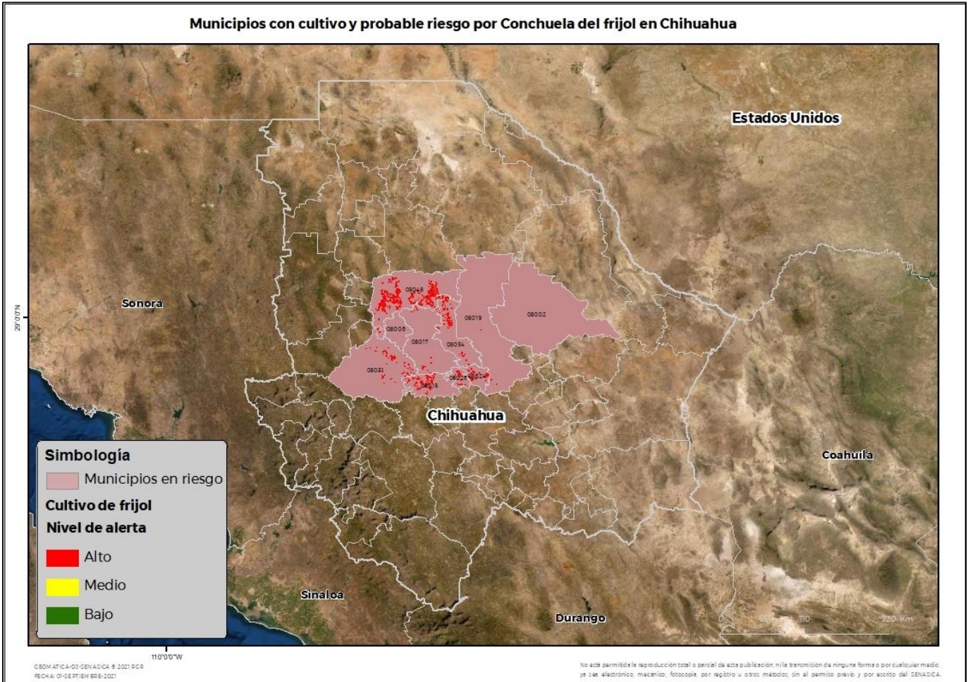
Municipios con cultivo y probable riesgo por Conchuela del frijol en Chihuahua

Anexo 1.- Se han identificado 10 municipios con alto riesgo y presencia del cultivo para el desarrollo de Conchuela del frijol, mismos que en caso de presentarse la plaga estarían en riesgo.