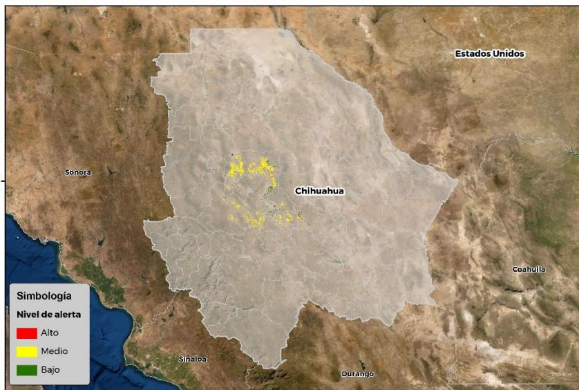
Nivel de alerta por Conchuela del frijol en Chihuahua

Se identifica que la plaga tiene bajas condiciones para comenzar su desarrollo debido a que se identificaron 15 municipios en riesgo fitosanitario medio (Anexo 1)