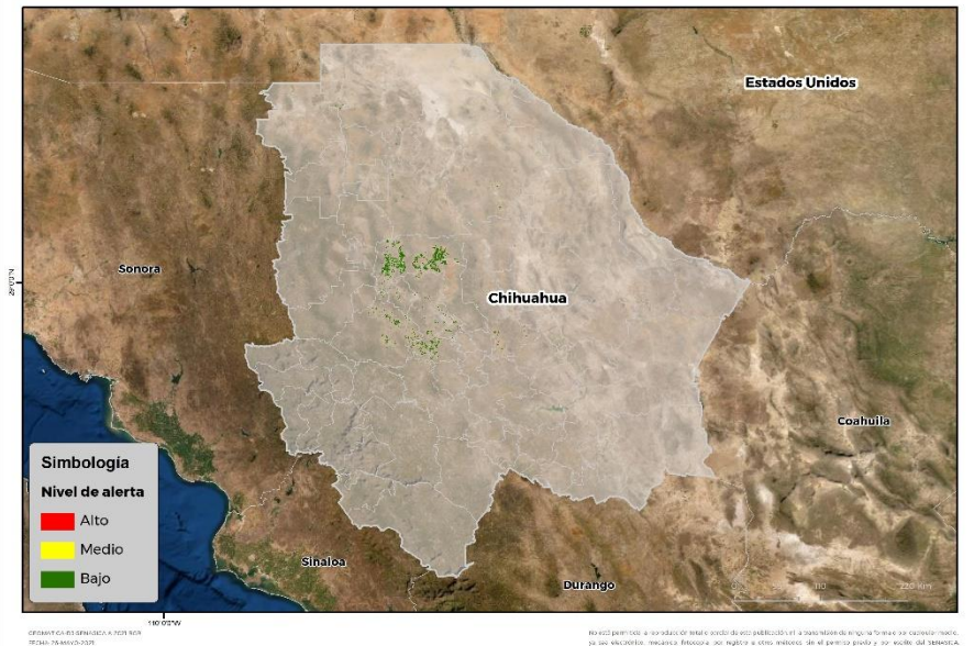
Nivel de alerta por Conchuela del frijol en Chihuahua

Se identifica que la plaga tiene bajas condiciones para comenzar su desarrollo debido a que se identificaron 11 municipios en riesgo fitosanitario bajo (Anexo 1)