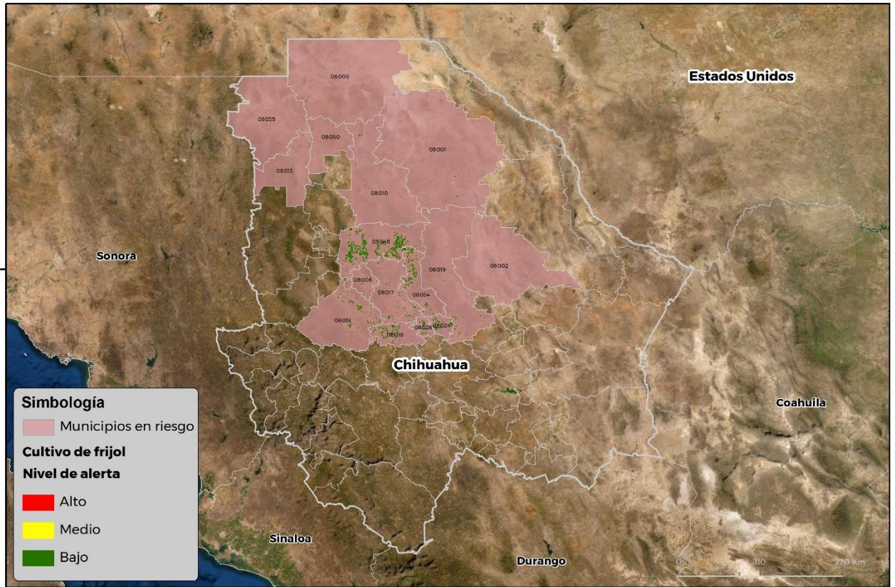
Municipios con cultivo y probable riesgo por Conchuela del frijol en Chihuahua

GEOMATICA-DJ-SENASICA © 2021 RCR FECHA 28-JULIO-2021