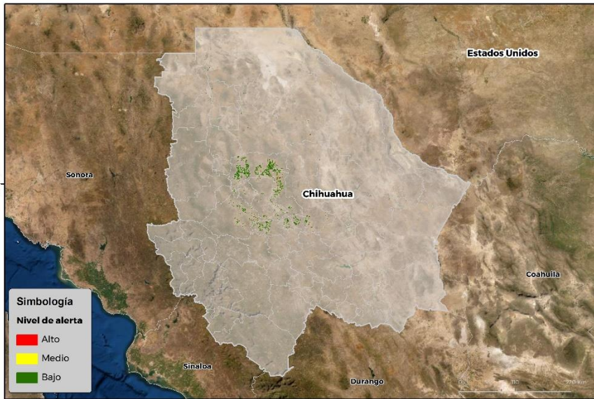
Nivel de alerta por Conchuela del frijol en Chihuahua

Se identifica que la plaga tiene bajas condiciones para comenzar su desarrollo debido a que se identificaron 16 municipios en riesgo fitosanitario bajo (Anexo 1)