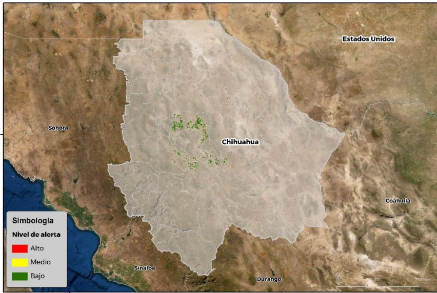
Nivel de alerta por Conchuela del frijol en Chihuahua

Se identifica que la plaga tiene bajas condiciones para comenzar su desarrollo debido a que se identificaron 16 municipios en riesgo fitosanitario bajo (Anexo 1)