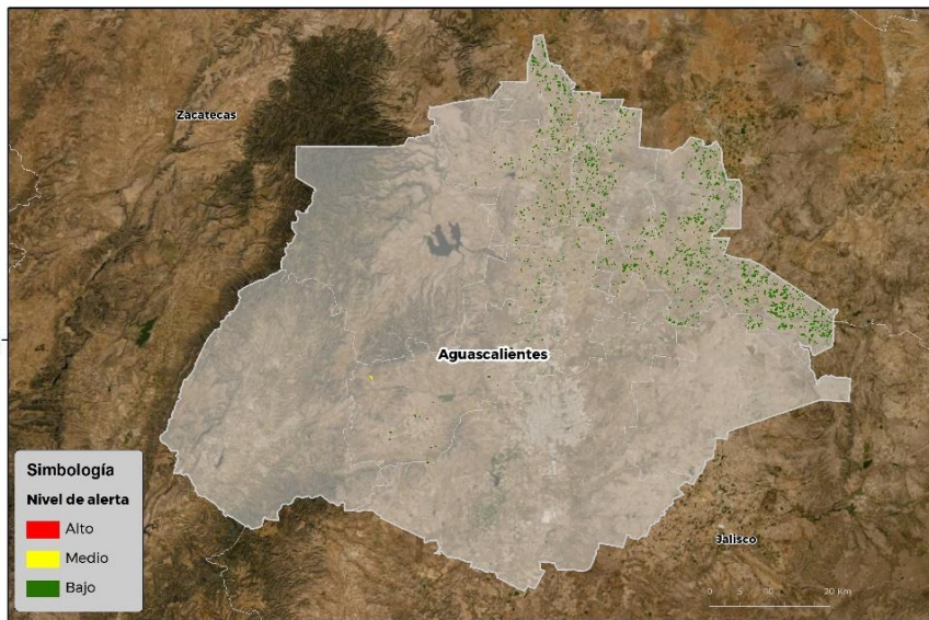
Nivel de alerta por Conchuela del frijol en Aguascalientes

Se identifica que la plaga tiene bajas condiciones para comenzar su desarrollo debido a que se identificaron 6 municipios en riesgo fitosanitario bajo y medio (Anexo 1).