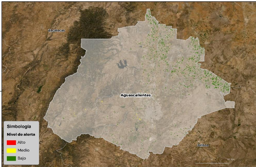
Nivel de alerta por Conchuela del frijol en Aguascalientes

Se identifica que la plaga tiene bajas condiciones para comenzar su desarrollo debido a que se identificaron 9 municipios en riesgo fitosanitario bajo y medio (Anexo 1).