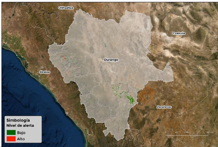
Nivel de alerta por Roya de frijol en Durango

Se identifica que la roya de frijol puede iniciar su proceso de infección debido a que hay: • Condición favorable en 8 municipios bajo riesgo fitosanitario . • Etapa fenológica susceptible del frijol y hospedantes alternos (Anexo 1).