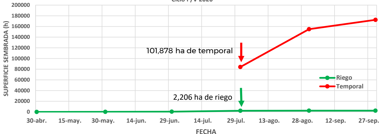
Avance de siembra de frijol en el estado de Durango al 03 de agosto de 2020. Ciclo P/V 2020

Se estima que a la fecha se han establecido en el estado aproximadamente 2,206 ha de frijol bajo condiciones de riego, y 101,878 ha de frijol de temporal.